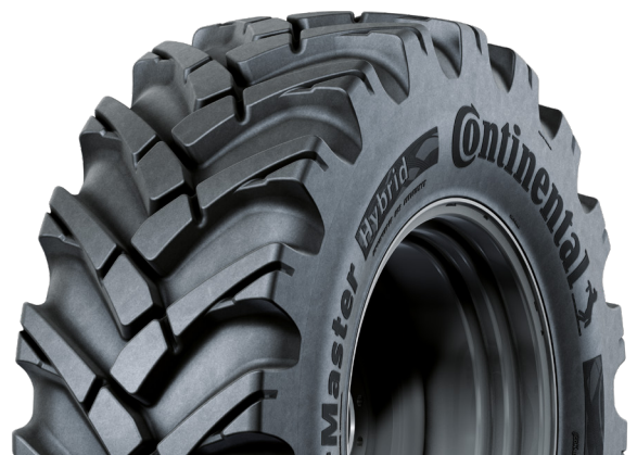
VF TractorMaster Hybrid