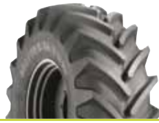
MICHELIN XM 28