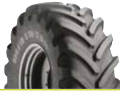
MICHELIN XM 27