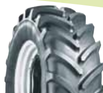
MICHELIN XM 108