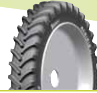
MICHELIN AgriBib Row Crop